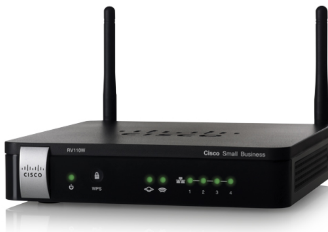
Figura 1. Firewall VPN Cisco RV110W Wireless-N

El Firewall VPN Cisco® RV110W Wireless-N ofrece conectividad a Internet de clase empresarial sumamente segura, simple y asequible para oficinas pequeñas o en el hogar, y para trabajadores remotos.